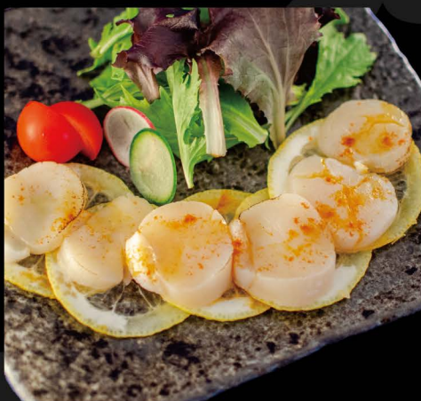
トリュフ香る ホタテカルパッチョ 15,50€ Hotate Carpaccio (Jakobsmuschel Carpaccio mit Trüffelöl)