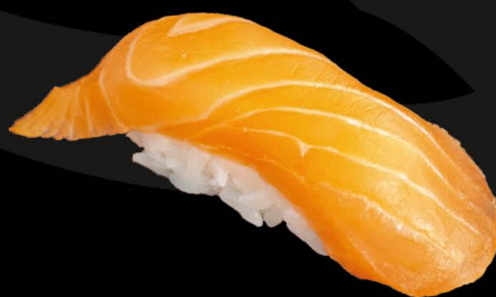
鮭 3,50€ Sake (Lachs)