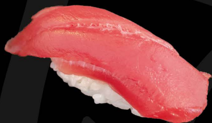
スペイン産本鮪赤身 4,50€ Maguro Akami (Bluefin Thunfisch fettarm)