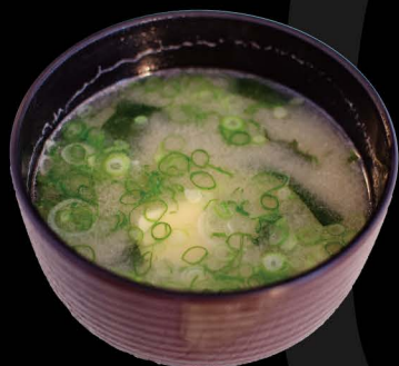
味噌汁 3,80€ Miso Suppe