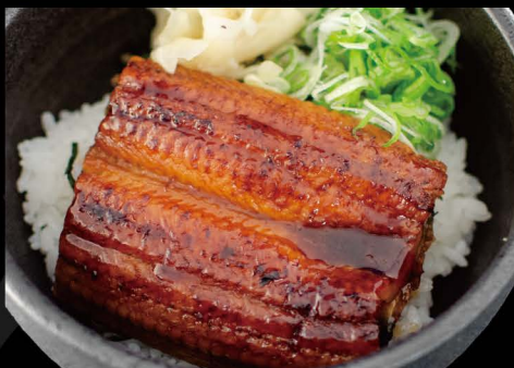
うなぎ丼 Half 21,50€ Full 38,50€ Unagi Don (Gegrillter Aal mit Teriyaki Sauce auf Reis)