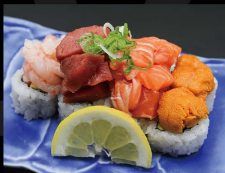
豪華のっけもりロール 28,50€ Nokkemori Roll (Seeigel, Thunfisch, Lachs und Eismergarnele auf California Rolle)