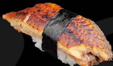
炙りうなぎ 6,50€ Unagi (flambierter Aal)