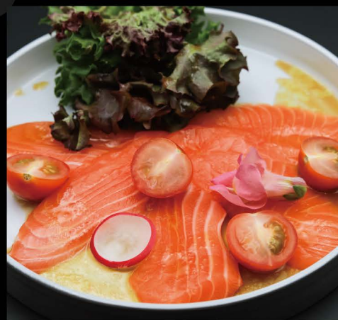
鮭カルパッチョ 14,50€ Sake Carpaccio (Carpaccio mit flambiertem Lachs)