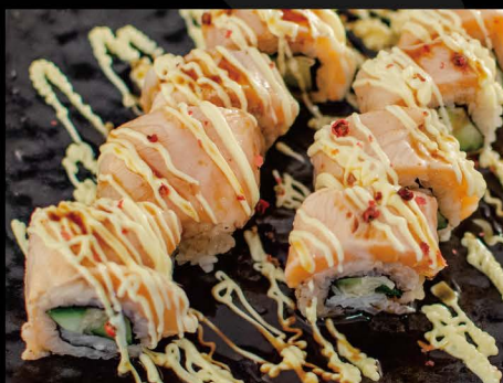
スターロール 15,50€ Star Roll (Gegrillte Lachs, Teriyaki Soße, Mayonase)