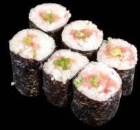
葱トロ 8,50€ Negitoro (Thunfisch mit Lauch)

納豆 4,50€ Natto Maki (fermentierte Sojabohnen)