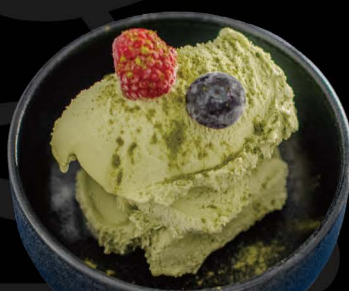
抹茶アイス 6,00€ Matcha Eis

Bei Fragen zu Allergenen wenden Sie sich bitte an unsere Mitarbeiter.