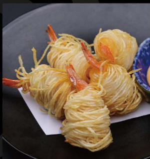
巣籠り海老揚げ 8,80€ Sugomori Ebi Age (Garnelen im Kartoffelnest)