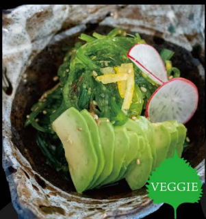
ごまワカメとアボカド 6,50€ Goma Wakame (Eingelegter Seetang und Avocado)