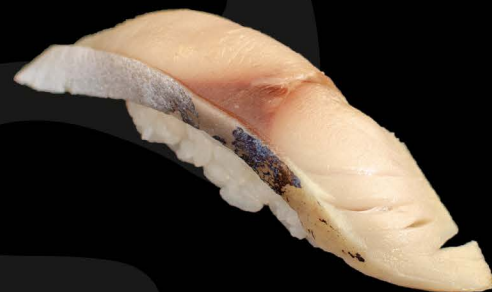
み鯖 4,00€ Shimesaba (eingelegte Makrele)