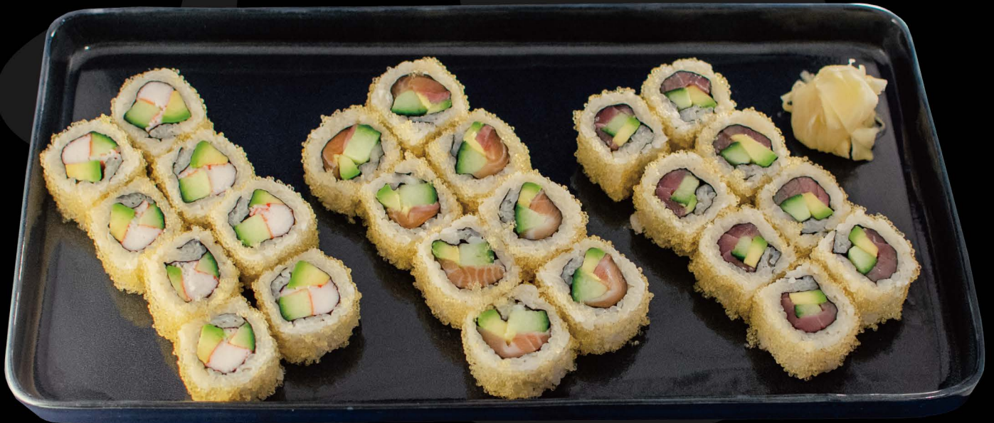
カリフォルニアロール 12,00€ California Rolle (Surimi*, Gurke, Avocado)