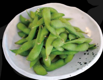
枝豆 5,00€ Edamame (Gekochte Sojabohnen)