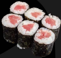
鉄火 7,50€ Tekka Maki (Thunfisch)