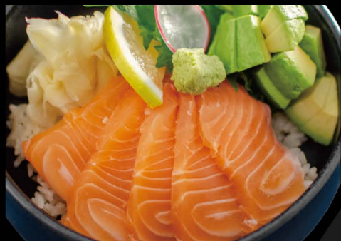
鮭アボカドハーフ丼 18,50€ Half Sake Avo Don (Lachs Sashimi und Avocado auf Reis)