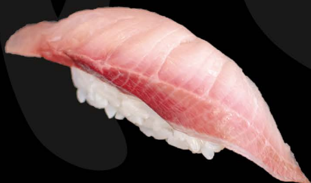
宮崎県産黒瀬ブリ 4,50€ Buri (Gelbschwanzmakrele aus Mizayaki, Japan)