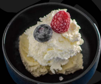
バニラアイス 5,00€ Vanilleeis