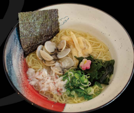
みの鯛だし潮ラーメン (札幌直送西山製麺中華麺使用) 限定 17,00€ ハーフ 9,00€ Shio Ramen (Limited Edition Shio Ramen) 17,00€ Half 9,00€