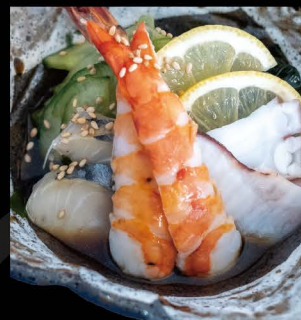
魚介の酢の物 12,50€ Gyokai Sunomono (Verschiedene Meeresfrüchte in Essigmarinade)