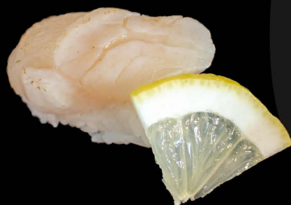
帆立 5,00€ Hotate (Jakobsmuschel)