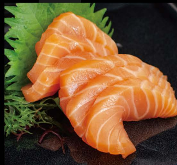
ノルウェー産 鮭 14,50€ Sake (Lachs aus Norwegen)