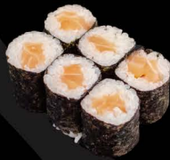
鮭トロ 5,50€ Saketoro (Lachs m. Fett durchzogen)