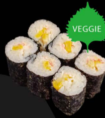
たくあん 4,50€ Takuan Maki (eingelegter Rettich)