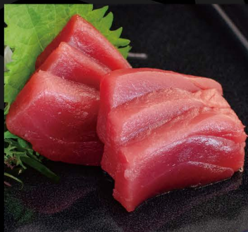
スペイン産 本マグロ赤身 18,50€ Maguro (Bluefin Thunfisch)