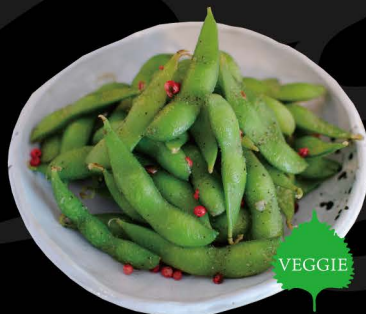
ブラック枝豆 6,00€ Black Edamame (Gekochte Sojabohnen mit Sesamöl)