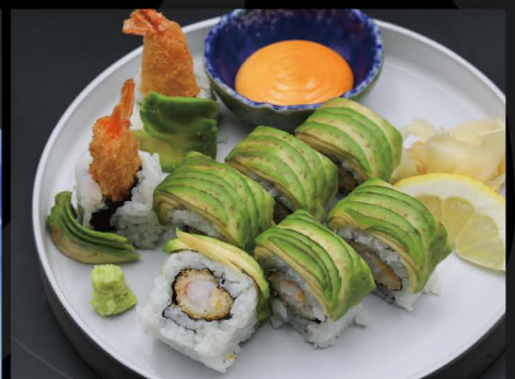
ドラゴンロール 15,50€ Dragon Roll (Frittierte Garnele, Avocado, Teriyaki Soße, Mayonase)