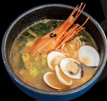
寿司屋のあら汁 10,00€ Spezial Miso Suppe (aus hausgemachter Fischbrühe)