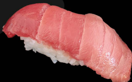
スペイン産本鮪中トロ 6,50€ Maguro Chutoro (Bluefin Thunfisch leicht fettig)