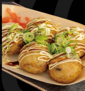
たこ焼き 8,00€ Takoyaki (Oktopusstücken in Teigkugeln)