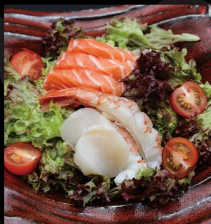
オーシャンサラダ 14,80€ Ocean Salat (Gekochte Garnelen, Jakobsmuschel, Lachs, Salat-Sesam Dressing mit Trüffelöl)