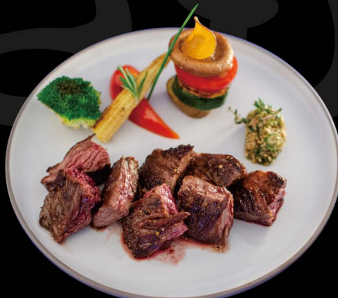
牛ハラミカットステーキ 小ライス付き 24,50€ 200g Gyu Harami mit kleine portion Reis (Skirt Steak vom US-Rind mit hausgemachter Berbecue Sauce)