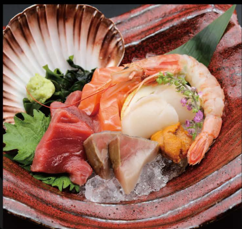
刺身 5 種盛り 34,50€ Sashimi Platte 5 Sorten 刺身 3 種盛り 20,00€ Sashimi Platte 3 Sorten