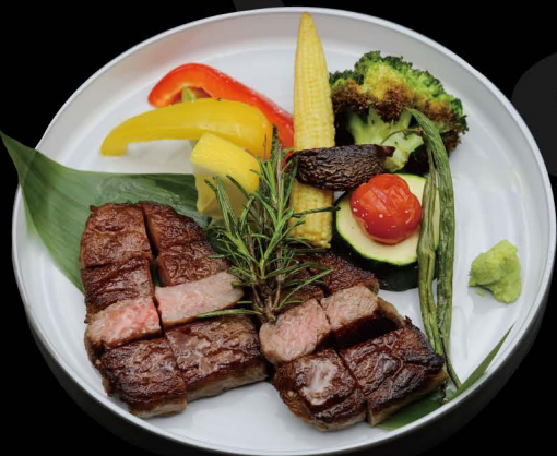
日本産和牛ステーキ 小ライス付き 130g 75,00€ 130g Wagyu Steak aus Japan mit hausgemachter Berbecue Sauce dazu kleine portion Reis