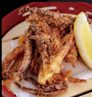
イカゲソの唐揚げ 七味マヨ添え 12,00€ Ikageso Karaage (Frittierte Tintenfisch- beine mit pikanter Mayo)

子持ち昆布の山葵菜漬け 6,00€ Komochi Konbu (Heringsrogen mit Alge eingelegt in Wasabi)