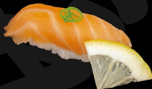
鮭トロ 4,00€ Saketoro (Lachs Bauchteil)