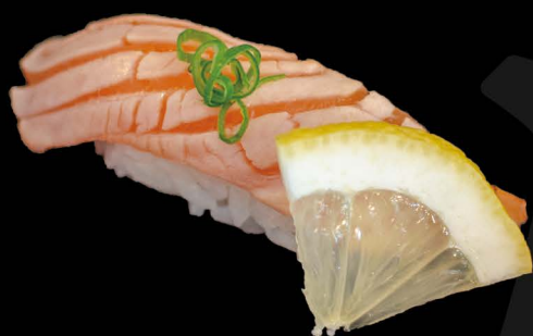
炙り鮭 4,50€ Aburi Sake (flambierter Lachs)