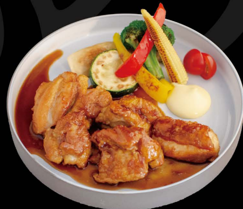
トウモロコシ鶏の照り焼き 小ライス付き 17,50€ Tori Teri mit kleine portion Reis (Maishähnchen Teriyaki)