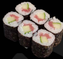
鉄胡瓜 6,50€ Tekkyu Maki (Thunfisch und Gurke)