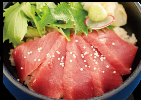
鉄火ハーフ丼 24,00€ Half Tekka Don (Thunfisch Sashimi auf Reis)