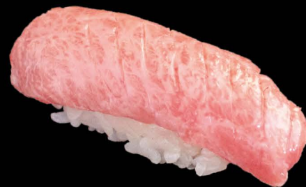
スペイン産本鮪大トロ 8,00€ Maguro Otoro (Bluefin Thunfisch fettig)