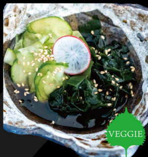
ワカメと胡瓜の酢の物 6,50€ Sunomono (Seetang und Gurke in Essigmarinade)