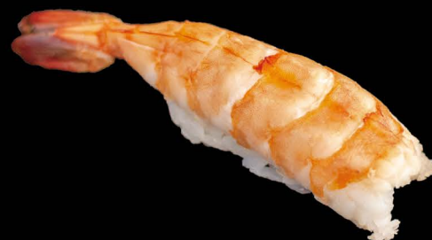
ボイル大海老 6,00€ Boil Ebi (Garnele gekocht)