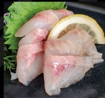
宮崎産 活メブリ 17,50€ Buri (Gelbschwanzmakrele aus Miyazaki, Japan)