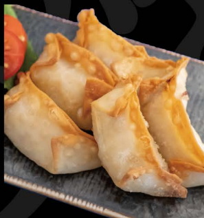
ベジ餃子 8,00€ Veggie Gyoza (Frittierte Veggie Teigtaschen)