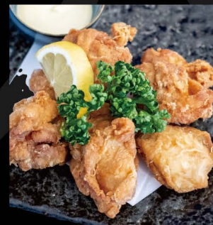
トウモロコシ鶏の 唐揚げ 柚子胡椒風味 12,50€ Tori Karaage (Frittierte marinierte Schenkelstücke vom Maishähnchen mit Yuzu-Mayo)