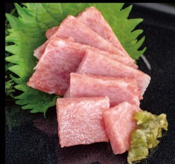
スペイン産 本マグロトロ刺し 28,00€ Maguro Toro (fettiger Bluefin Thunfisch)