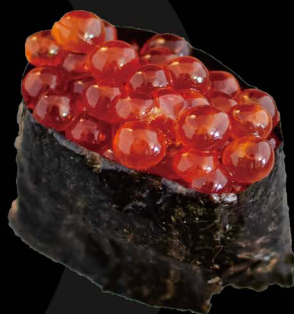
いくら軍艦 7,00€ Ikura (Lachsrogen)